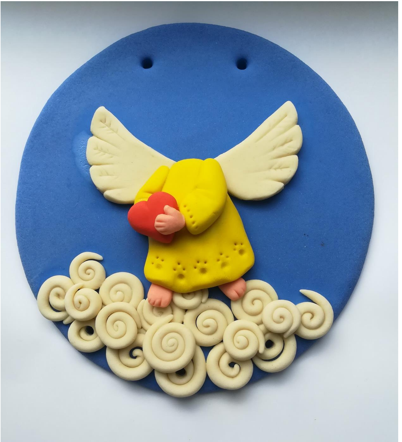
11. Приклеивание сердечка из красного теста и ладошки из розового теста.