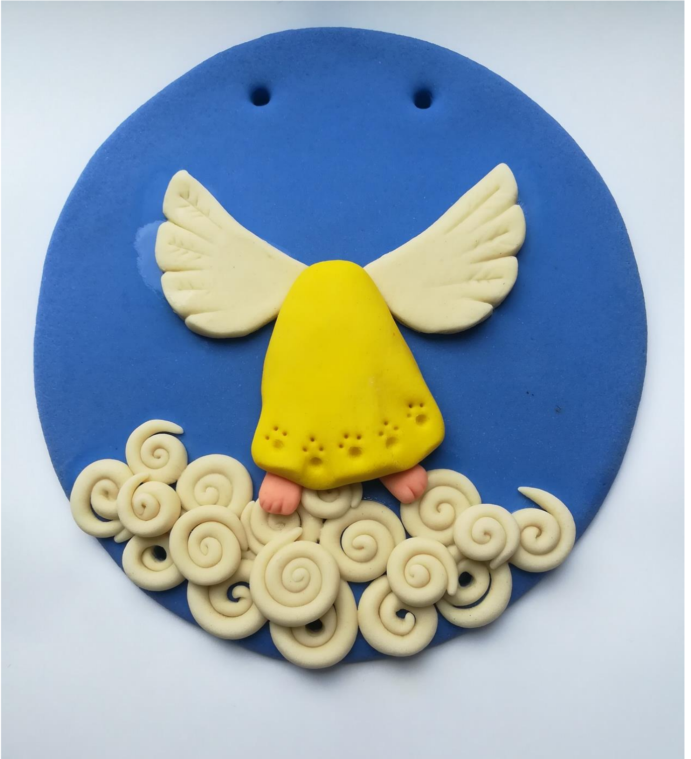
9. Формирование, декорирование и приклеивание платья.