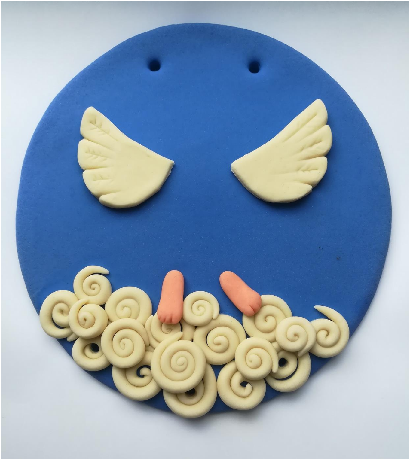
8. Лепка и приклеивание ножек ангела из розового теста.