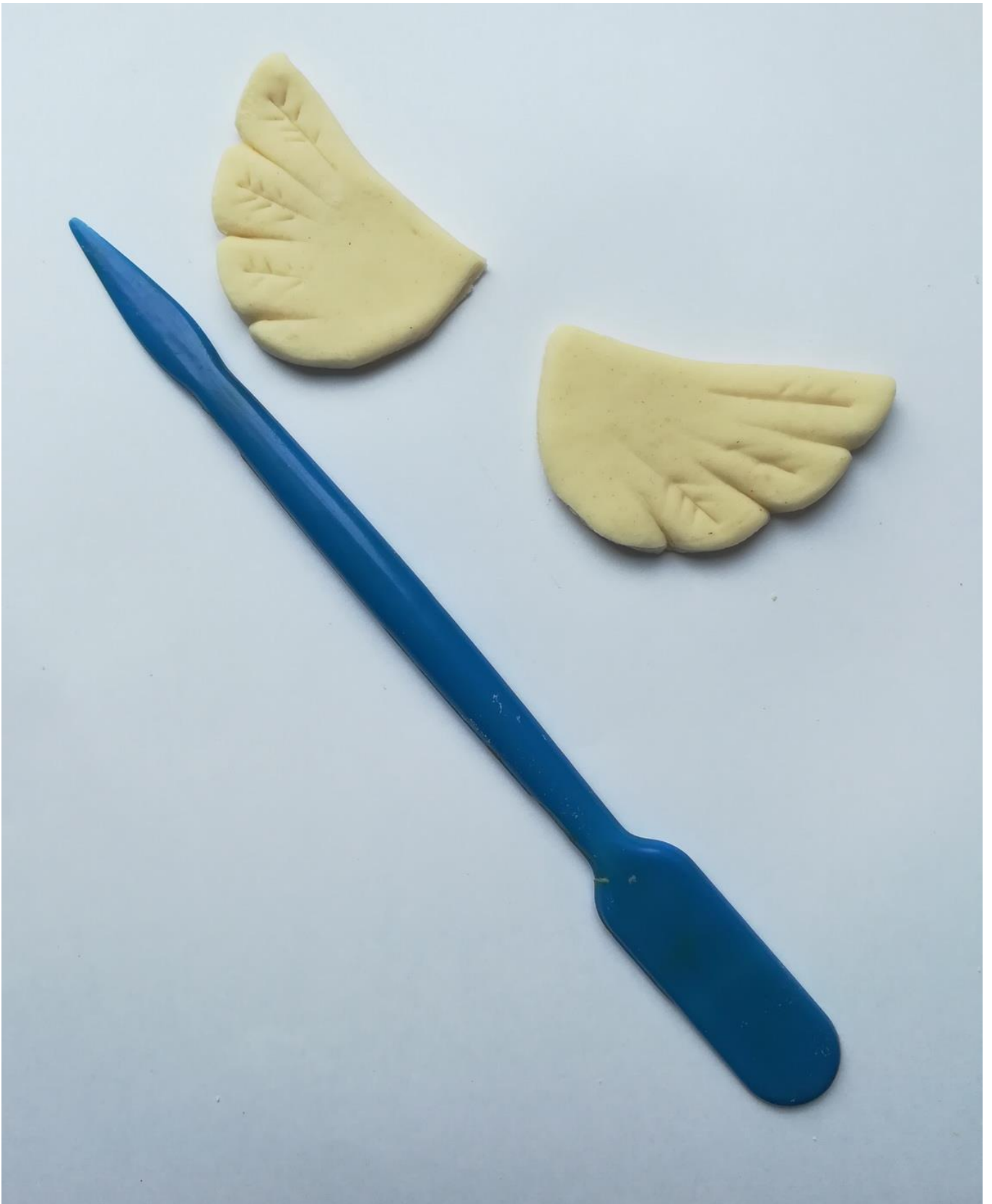
6. Вырезание и детализовка крылышек из пласта теста белого цвета.