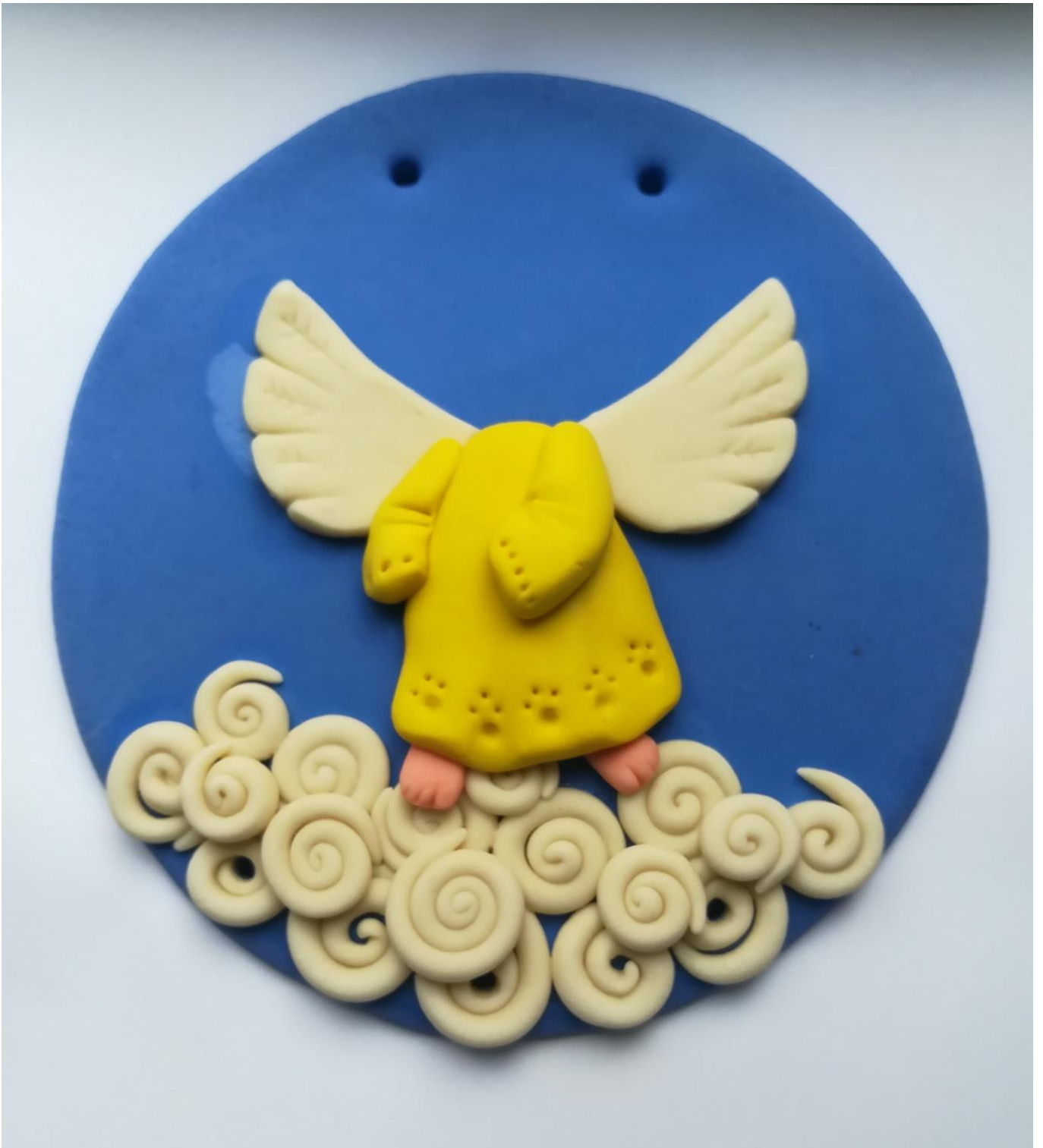
10. Лепка и приклеивание рукавов.