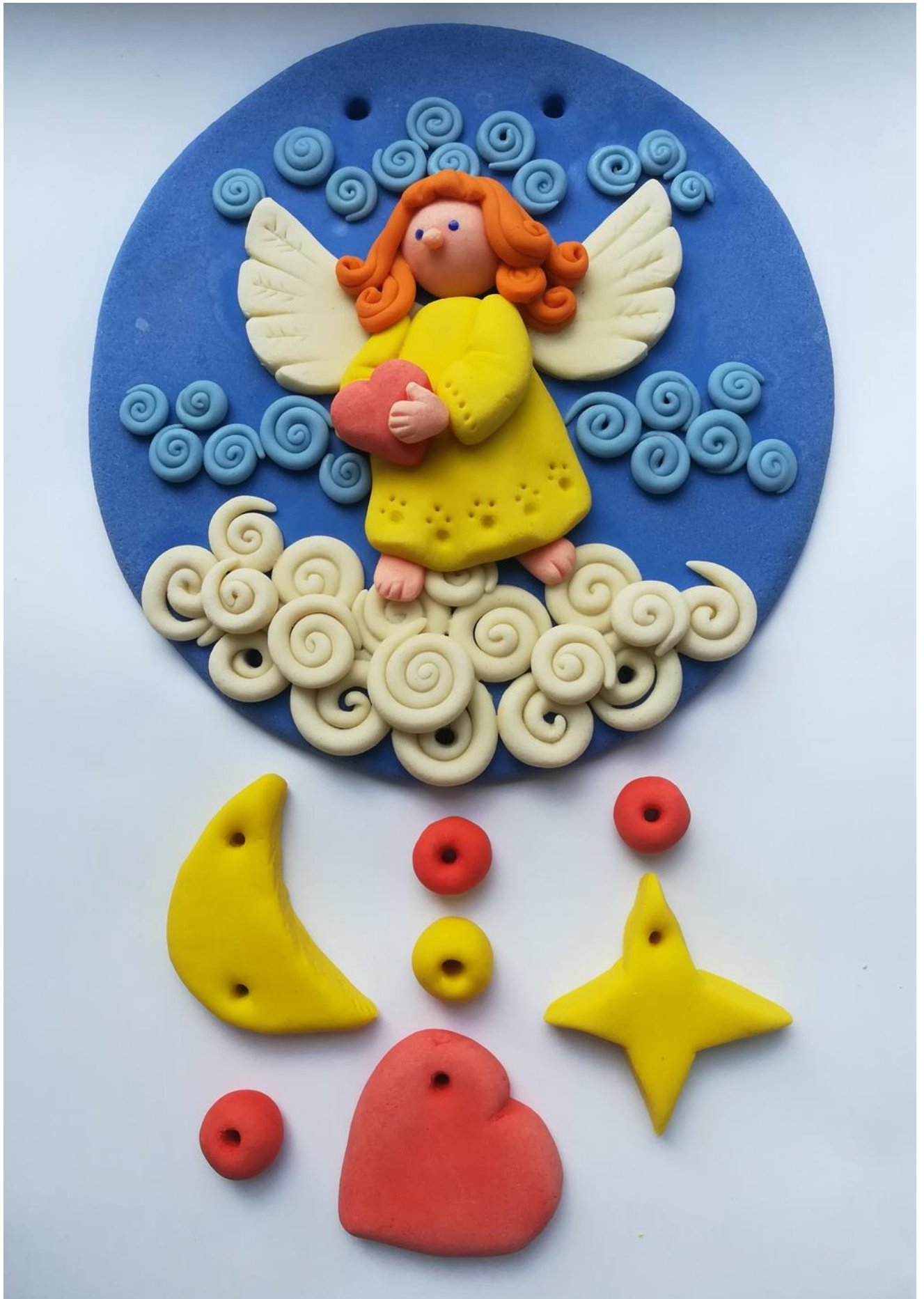
16. Добавление мелких деталей и завершение работы.