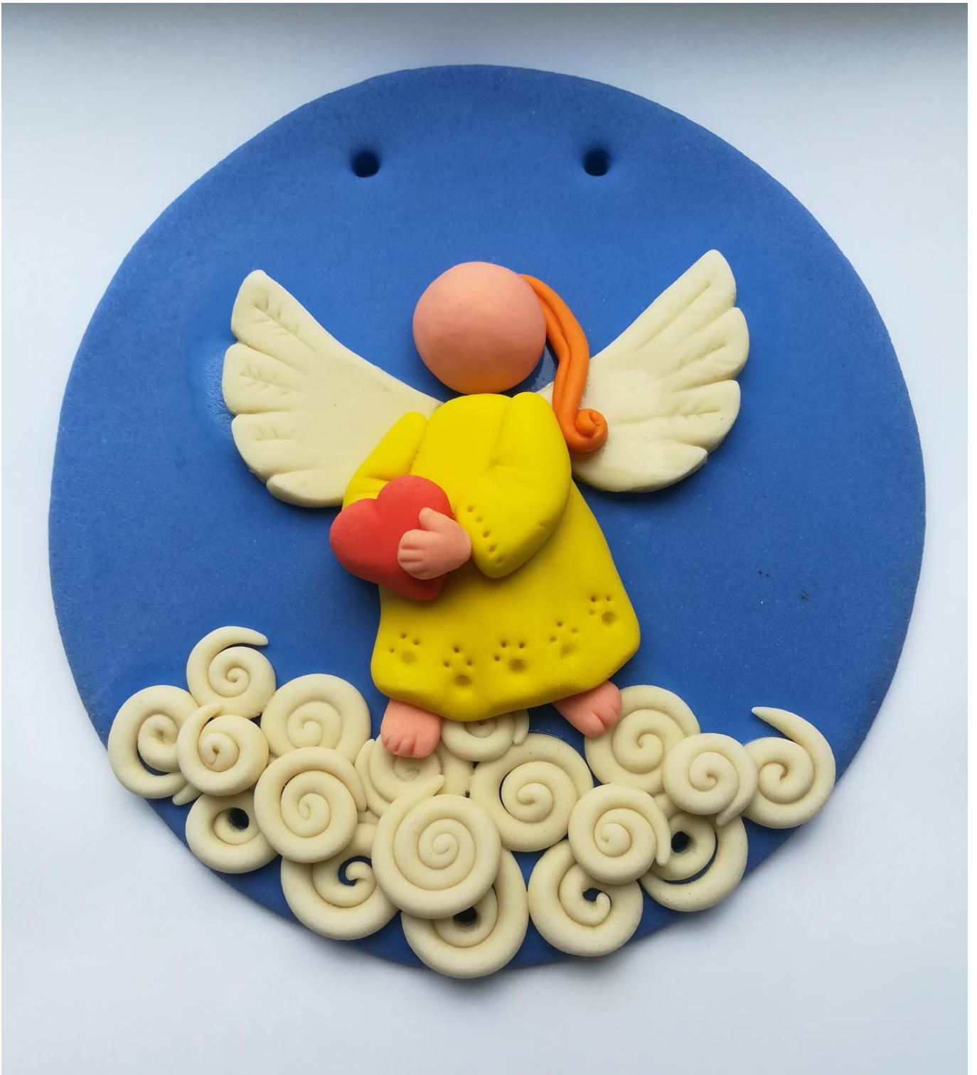
13. Лепка и приклеивание прядки волос.