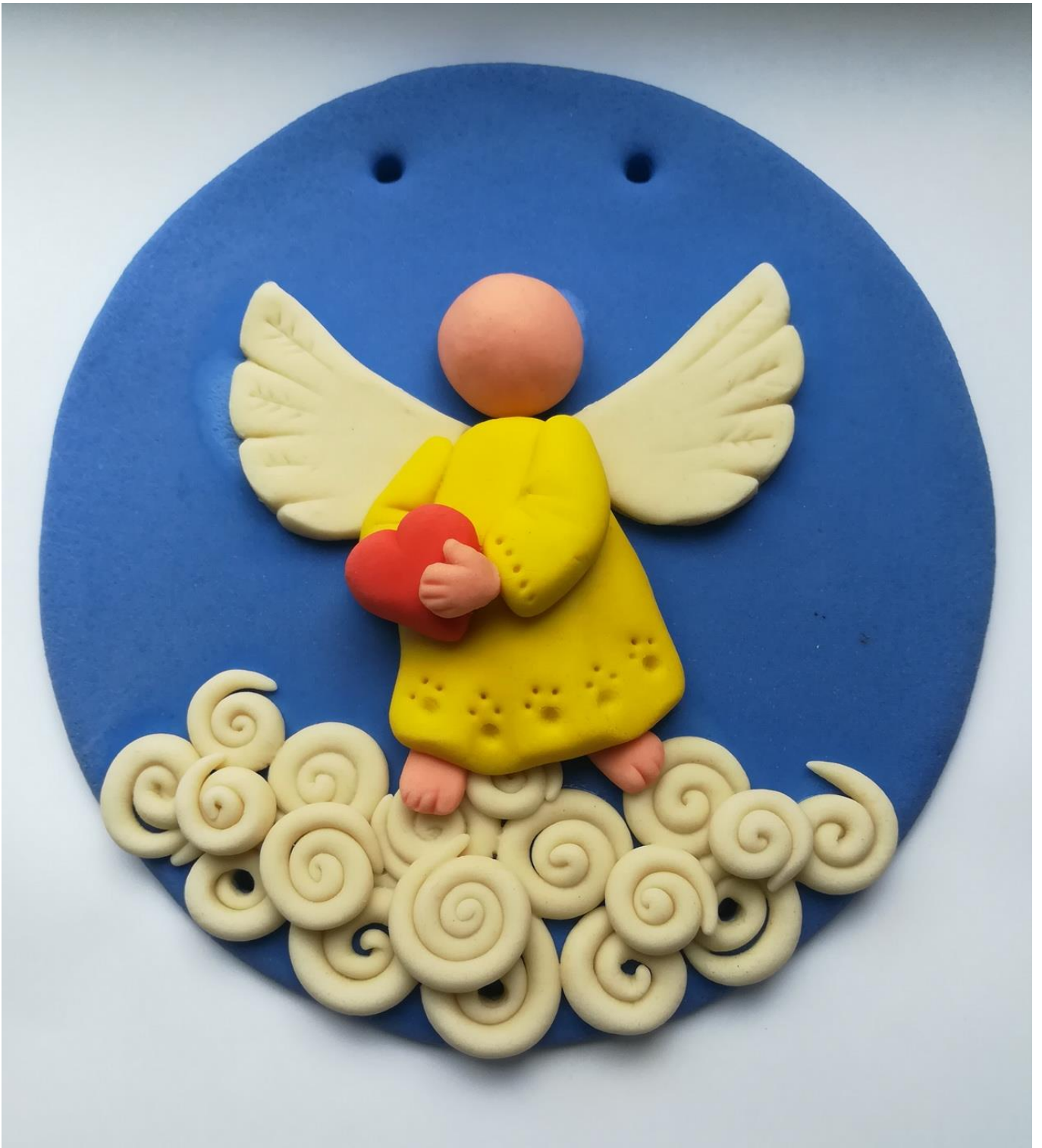
12. Формирование в виде круглого пряничка головы ангела.