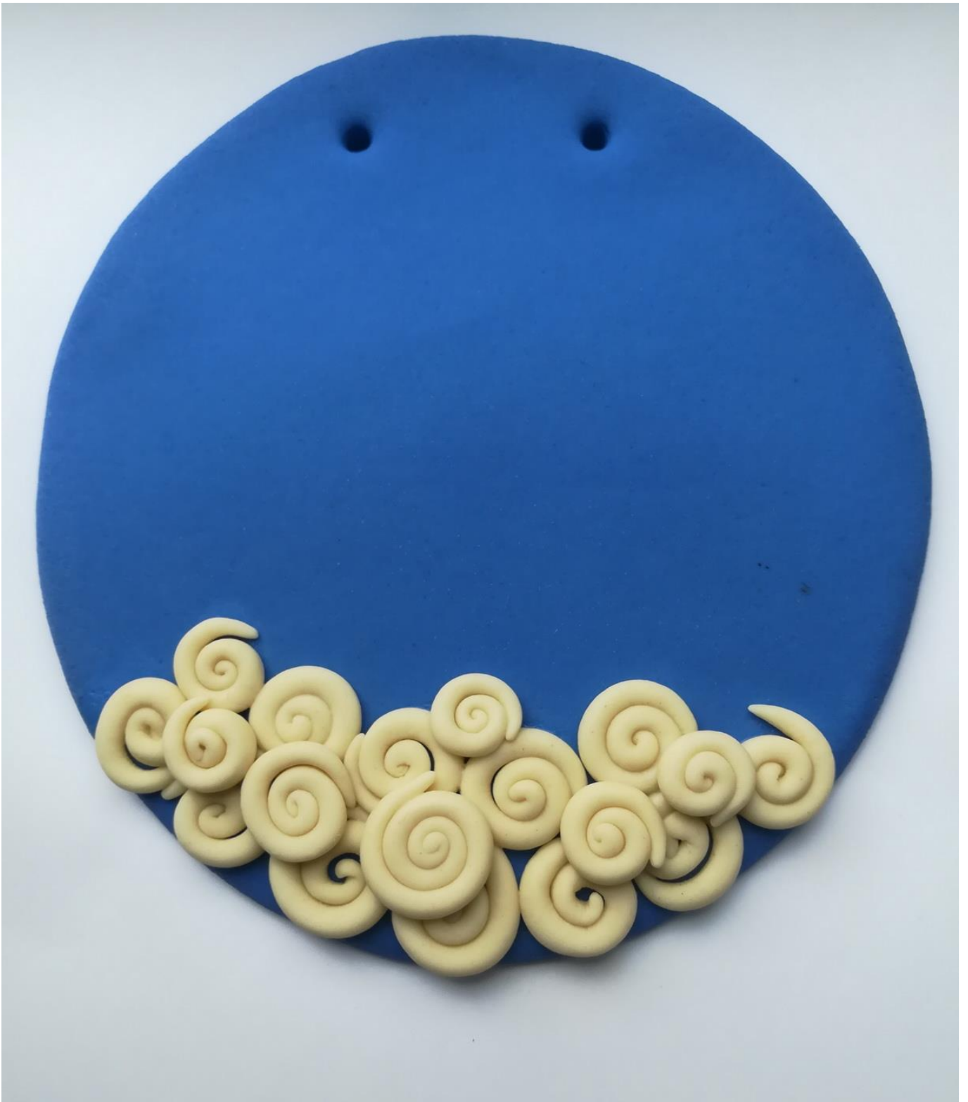
5. Формирование облака из завитков белого цвета.