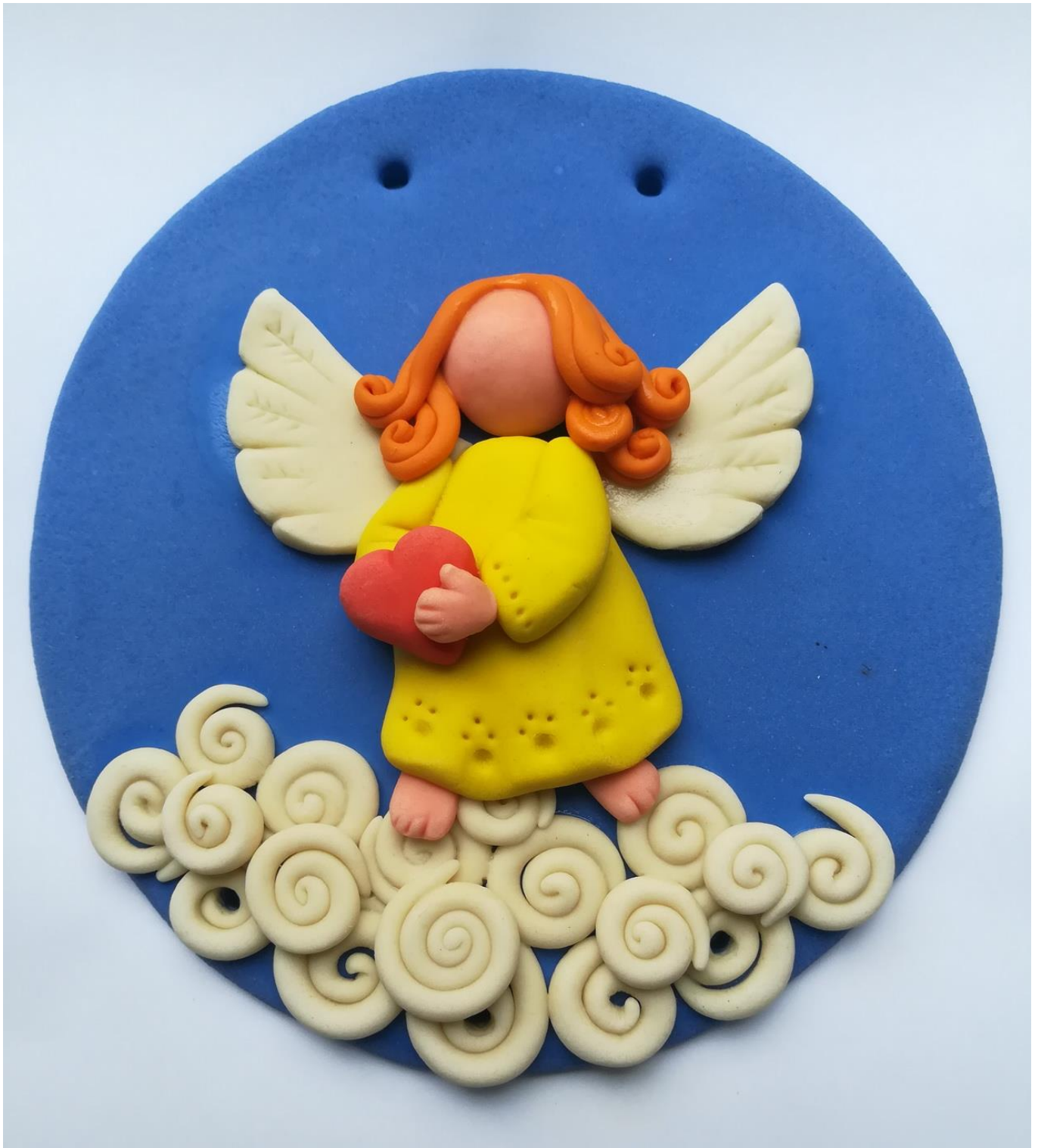
14. Приклеивание прядок волос в произвольном порядке при помощи воды.