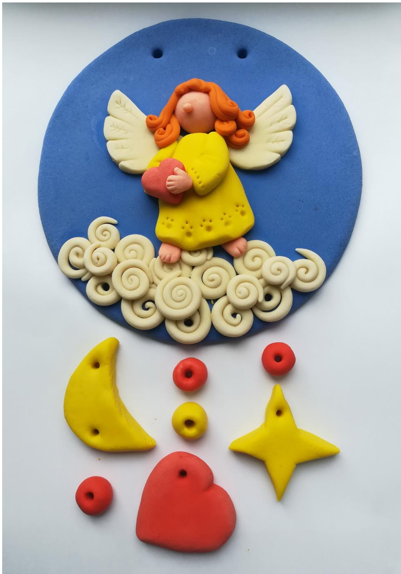
15. Лепка дополнительных подвесок из разноцветного теста.